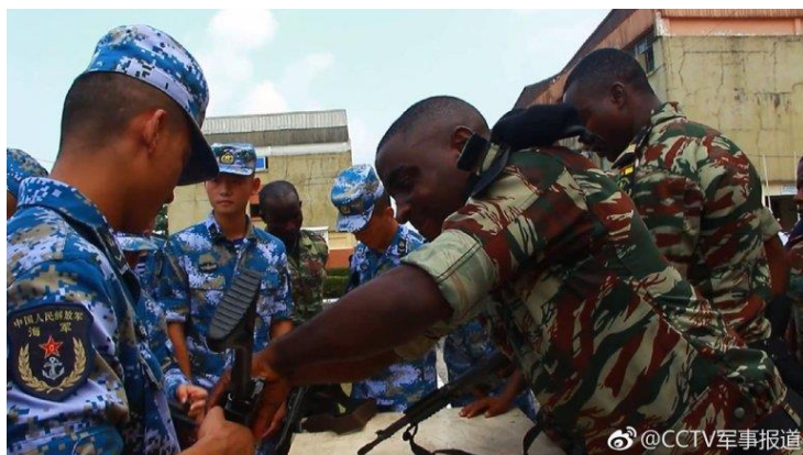
Photo I: Formation conjointe entre l'armée populaire de libération et un bataillon de l'armée camerounaise en 2018