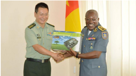
Photo 2 : Dons de matériel de communication de la Chine à l'armée Camerounaise