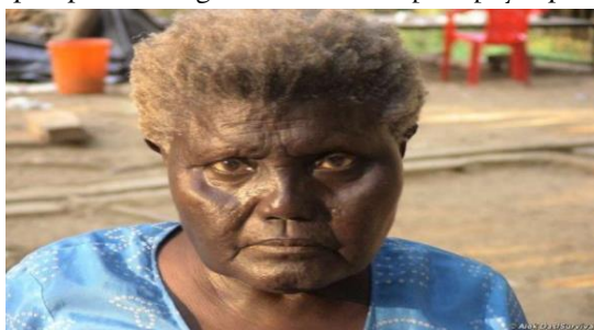
Photo 3.5. Femme andamanaise aux traits africains