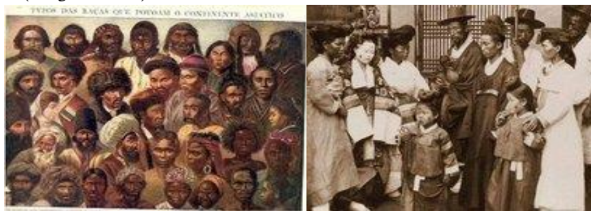
Photo 3.I. De gauche à droite, une dynastie noire et une cérémonie de mariage noire en Chine

Cet ouvrage nous renseigne sur la descendance de ces singes qui ressemblent aux humains. Dans une approche similaire, une source extraite des publications de vulgarisation apporte un peu plus d'explications sur l'itinéraire et les motifs de cette présence d'Hommes singes retrouvés en Chine. De cette source, on peut lire qu'un groupe de grands singes, dont le plus connu est le proconsul, vivait dans les forêts africaines il y a plus de vingt millions d'années. Huit millions d'années après, un événement bouleverse leur histoire (De Jaret, 2000, p.345). Des textes de chroniqueurs chinois confirment non seulement la proximité entre les singes et les Hommes, mais aussi, ces derniers mentionnent l'existence d'un empire noir dans le sud de la Chine (Chang Hsing, 1939, p.782). Pour comprendre les raisons de la méconnaissance de cette préhistoire chinoise mal connue, on note que sous les anciens gouvernements impériaux et même républicains chinois, les fouilles furent interdites. Les données réelles n'ont été récoltées qu'au début du XX ème siècle dans les grottes et les cavernes. Ces données présentent plusieurs indices noirs dans cette partie du globe à l'exemple de ces images illustrant d'un côté, une dynastie noire chinoise (image à gauche) et, de l'autre, une cérémonie de mariage noir en Chine vers 1900 (image à droite).