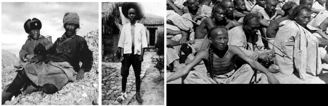
Photos 3.3 et 3.4. Le peuple du Tibet au début du XX ème siècle

Plusieurs objets d'archéologie notamment des statuettes retrouvées dans différentes régions de la Chine témoignent aussi de l'existence d'une population noire en Chine (Kwang Chi, 1986, p.99). Ces statuettes nous renseignent sur les traces noires disparues autour des années 1920. Cet archéologue a confirmé l'importance de la population noire au vu des fouilles entreprises. Au-delà de cette confirmation, les chroniqueurs ont de tout temps rapporté l'existence d'un empire noir ayant existé au sud de la Chine (Kwang Chi, 1986, p.100). De gauche à droite, les photographies du peuple du Tibet et les élèves d'un temple au début du XX ème siècle.